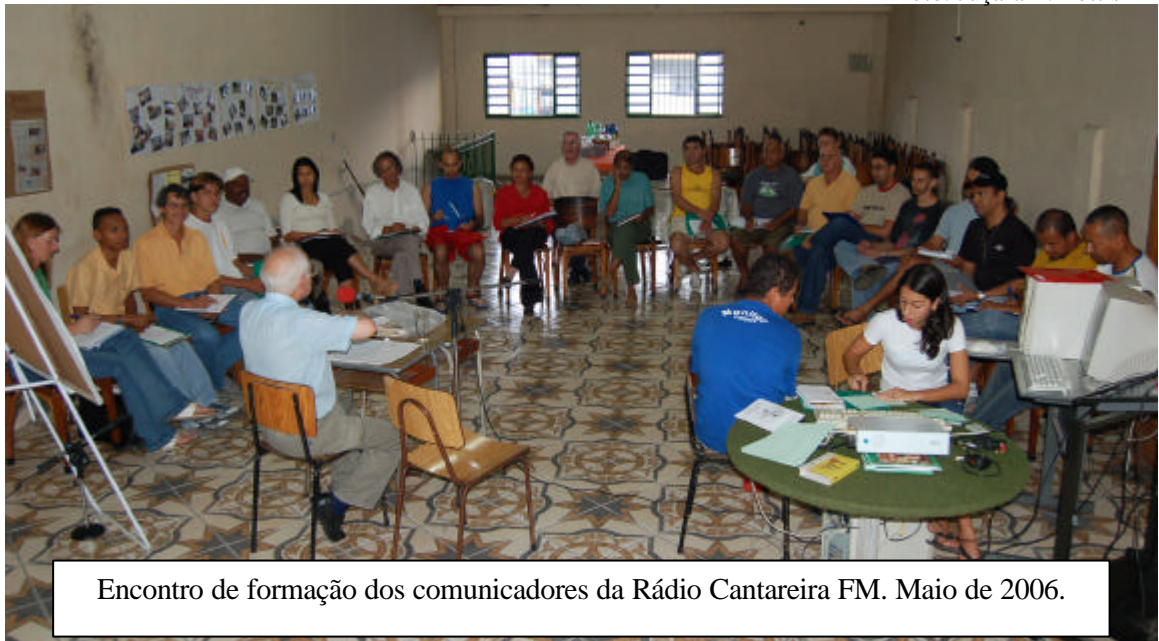
Encontro de formação dos comunicadores da Rádio Cantareira FM. Maio de 2006.

A capacitação das pessoas foi um marco importante no processo inicial da organização da rádio comunitária para contribuir no processo de pensar sobre o que é um projeto comunitário de comunicação, a sua incidência na vida do povo e a formulação da linha editorial. Para tanto, criou-se o primeiro curso de comunicação para radialistas, que foi desenvolvido entre os meses de outubro a dezembro de 1995, com 60 horas de duração. Participaram desse curso 65 pessoas. O curso de comunicação passou a ser promovido anualmente e tornou-se um critério básico para quem quisesse fazer parte da equipe da rádio e produzir programas na emissora.