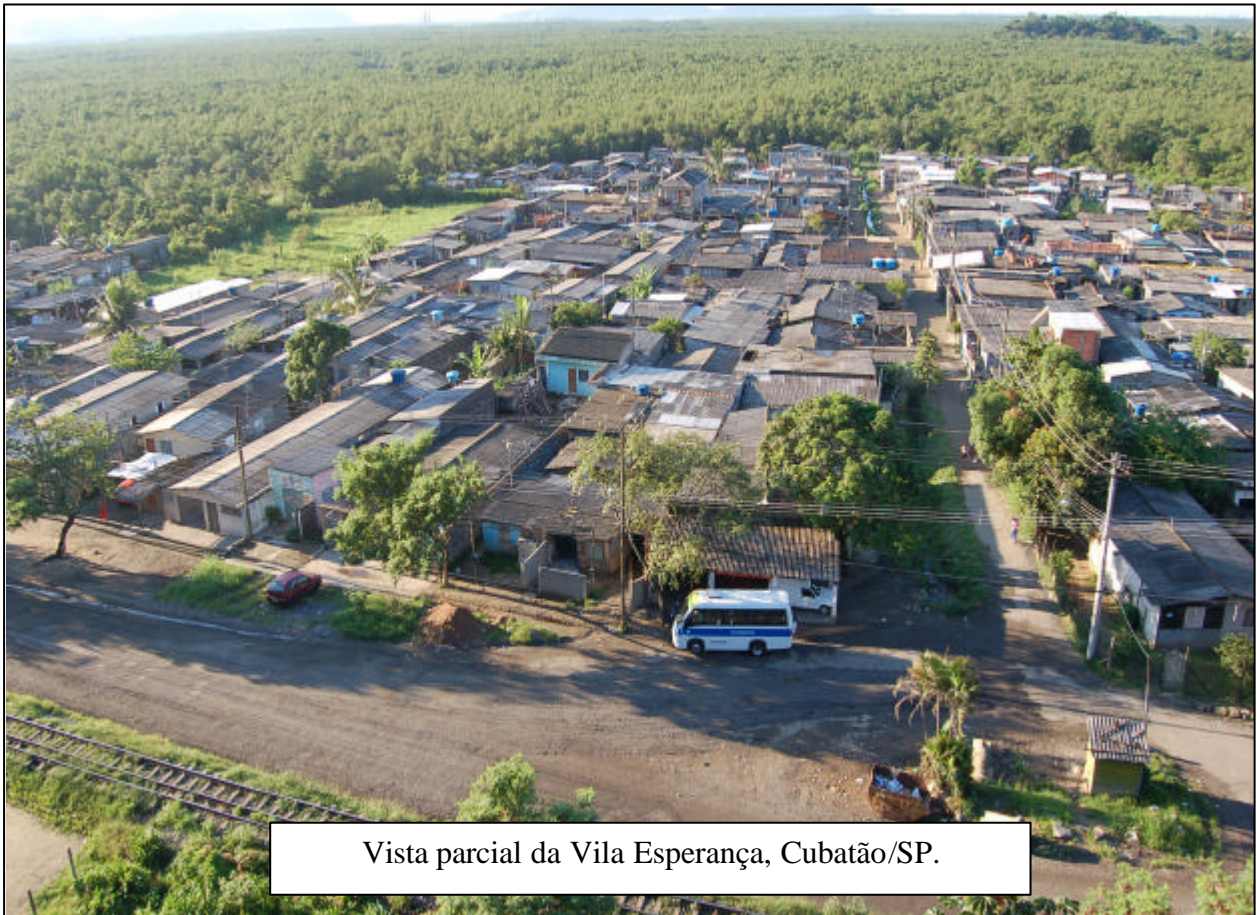
Vista parcial da Vila Esperança, Cubatão/SP.