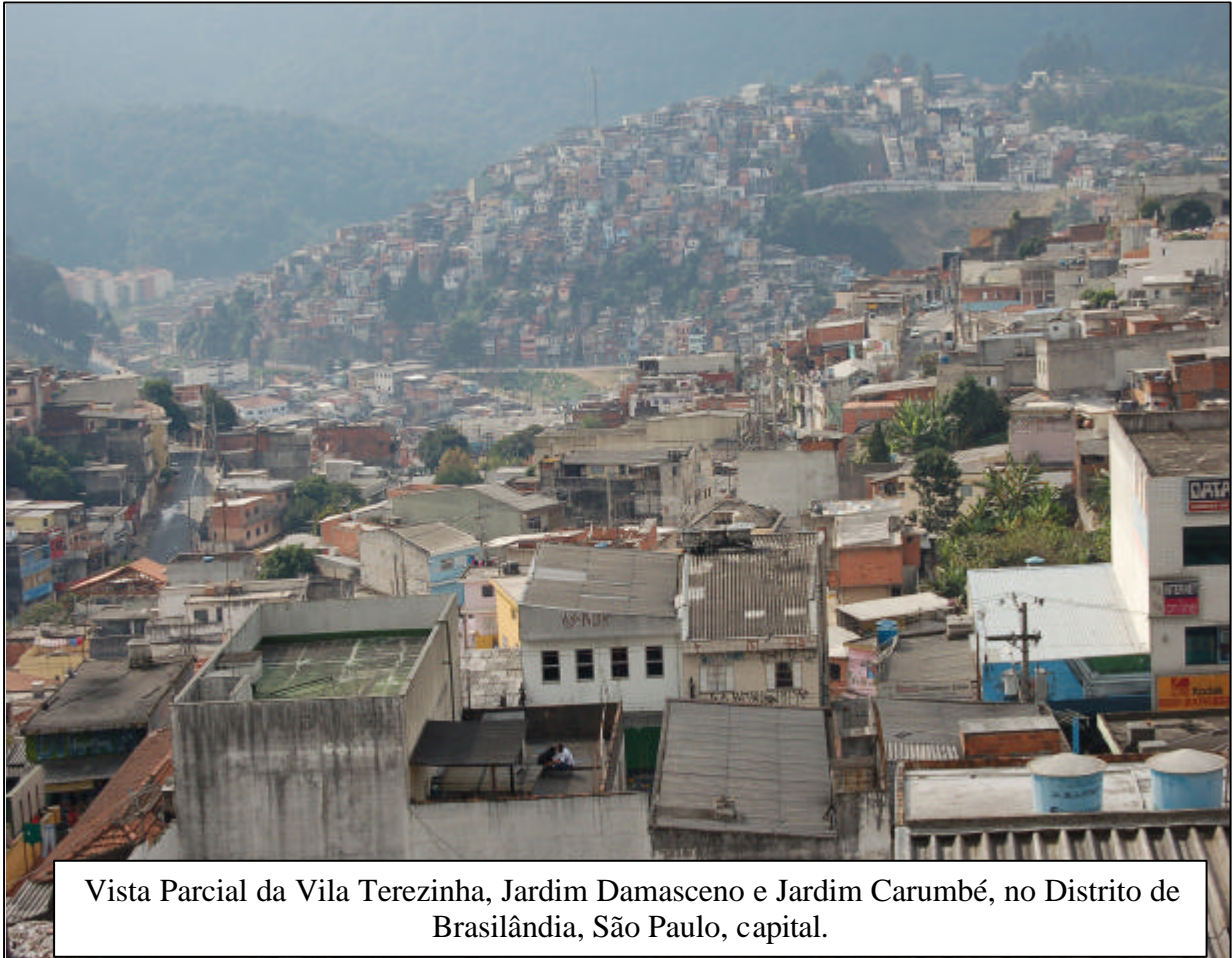
Vista Parcial da Vila Terezinha, Jardim Damasceno e Jardim Carumbé, no Distrito de Brasilândia, São Paulo, capital.

Os primeiros moradores do loteamento vieram das moradias populares e cortiços existentes no centro da cidade, demolidos para dar lugar às avenidas São João, Duque de Caxias e Ipiranga, durante gestão do prefeito Prestes Maia. Também vieram para a Brasilândia, na década de 1950, imigrantes portugueses e italianos que chegaram a São Paulo, além de interioranos do estado de São Paulo (de Jaú, Pederneiras e Bariri). Esse distrito da Brasilândia constituiu-se como região dormitório, ou seja, as pessoas moram nesse local, mas trabalham no centro da cidade e em municípios vizinhos.